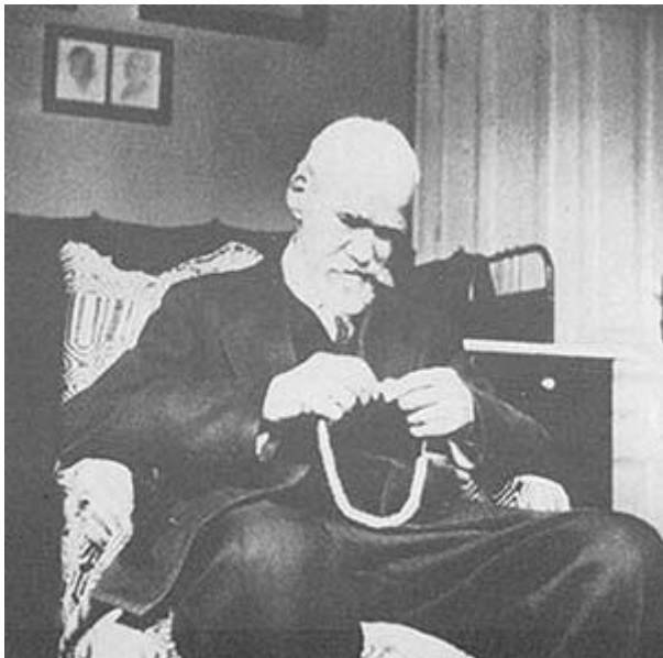
Една от последните му снимки. Писателят вече е спял.

С каква тъга е изобразил Влайков оная тъмна сянка над нашия селски бит от времето подир Освобождението, когато градът разстройва със своето зловредно влияние задружния труд и живот на патриархалното многочленно селско семейство («Чичо Стайко») или привличайки с неотразима сила в своя шум одного, автоматически повлича и другия, за да живее той последният там като неволник с тежка носталагия по тихия роден кът («Леля Гена»). А каква мила и до сълзи трогателна картина представлява «Житието на една майка» , която героично понася всички несгоди и с християнска добродетелна твърдост изживява своята тежка съдба; и какво рядко естетично чувство към природата приписва писателят на тая проста българка, за да отиде тя в градината, узнала предсмъртния си час, и да целуне за «сбогом» дърветата, които сама била някога насадила! Такава изтънченост на една проста душа е рядко явление и в чуждата литература. И цялото творчество на покойния Влайков е изпълнено с тая проста красота: красота в опростената обстановка на живота, разсъблечен от външната и лишна натруфеност, и красота чрез простите изразни средства на родния български език.